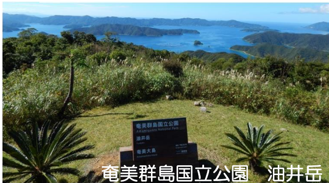
奄美群島国立公園 油井岳